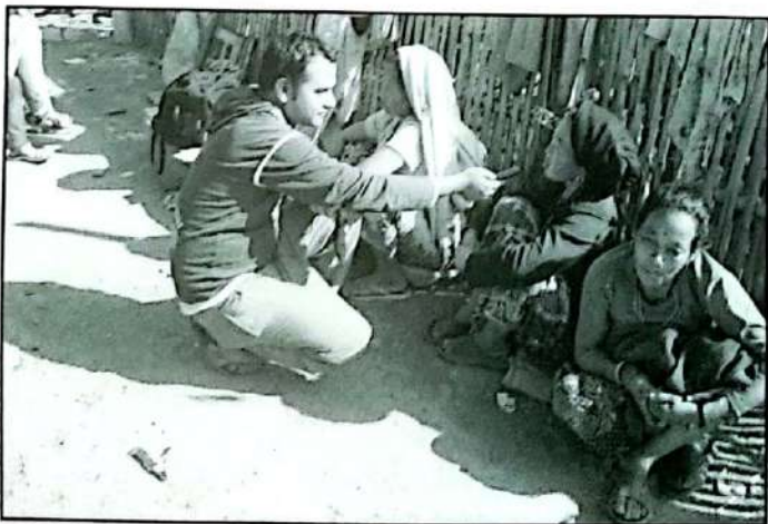
रेडियो कार्यक्रम महिला आवाजका लागि सूचना सामग्री संकलन गर्दै