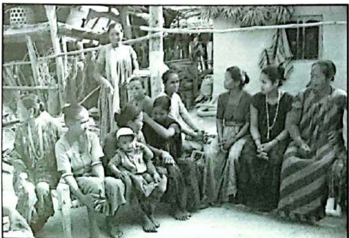
छलफलमा व्यस्त आदिवासी जनजाति महिलाहरू

नेपालमा सशस्त्र जनयुद्ध तथा सशक्त जनआन्दोलनको परिणामस्वरूप निरङ्कुश राजतन्त्रको अन्त्य भई नेपाल गणतन्त्रमा परिणत भइसकेको छ र अहिले