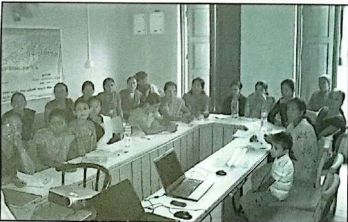
तालिममा सक्रियतापूर्वक सहभागीता जनाउँदै महिलाहरू

बेंसीशहर/सीमान्तकृत समुदायकका महिलाको राजनीतिमा पहुँच बढाउने उद्देश्यले लमजुङमा तीनदिने कार्यक्रम आयोजना गरियो । जिविस महासंघको अगुवाइमा विश्व परिदृश्य वकालत मञ्च र राष्ट्रिय आदिवासी जनजाति महिला मञ्चको आयोजना रहेको कार्यक्रमको लमजुङ जिविसले समन्वय गरेको थियो । पुप १४ देखि २६ गतेसम्म चलेको उक्त कार्यक्रमको विषय