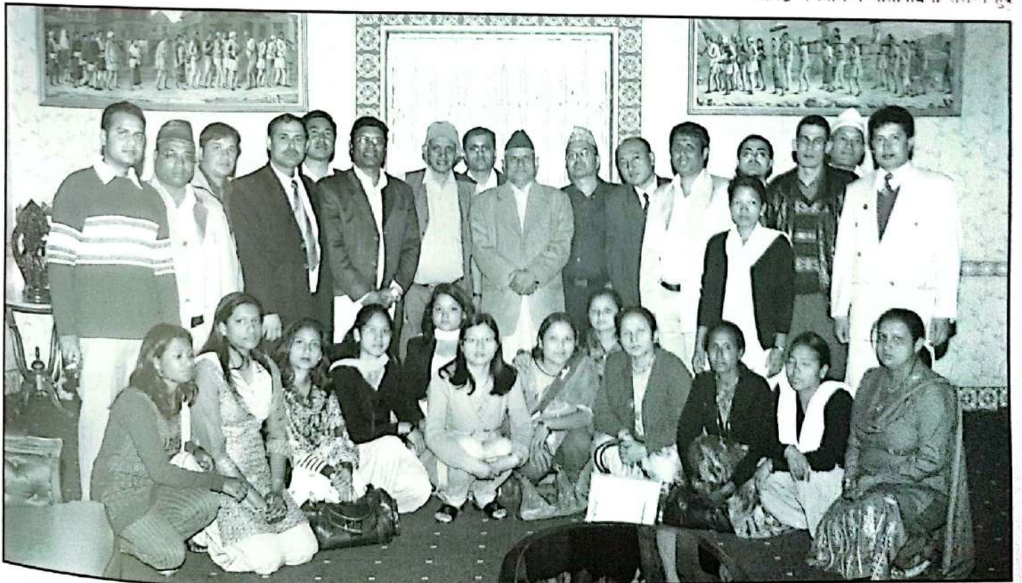
राष्ट्रपति डा रामवरण यादवका साथ लोकतान्त्रिक महिला मञ्चका प्रतिनिधिहरू

सरकारी तथा गैरसरकारी संस्थाहरूले प्रयास गरिरहेका छन् । जिल्ला विकास समिति महासंघ नेपालको अगुवाईमा विश्व परिदृश्य वकालत मञ्च र राष्ट्रिय आदिवासी जनजाति महिलामञ्चको सहकार्यमा सीमान्तकृत महिलाहरूको राजनैतिक सहभागिता अभिवृद्धि गराउने उद्देश्यका साथ नेपालको राजनीतिमा सीमान्तकृत महिलाहरूको सहभागिता अभिवृद्धि परियोजना सञ्चालनमा छ । परियोजनाले संखुवासभा, काभ्रेपलाञ्चोक, लमजुङ, बाँके र कञ्चनपुरमा सीमान्तकृत महिलाहरूको समूह गठन गरि महिलाहरूलाई विभिन्न माध्यमबाट राजनैतिक सचेतता बढाउदै आइरहेको छ । लोकतान्त्रिक महिला मञ्चमा, सीमान्तकृत, आदिवासी जनजाति, दलित र पछार्ड पारिएका महिलाहरूको उल्लेख्य सहभागिता छ । राजनीति के हो ? राजनीतिमा महिला सहभागिता किन आवश्यक छ ? भन्ने यहाँका सीमान्तकृत महिलाहरूलाई थाहा थिएन । पुरुषप्रधान ग्रामीण समाजमा महिलालाई घर बाहिर निस्कन निकै गाह्रो छ । तर लोकतान्त्रिक महिला मञ्चमा आवद्ध भै विभिन्न गतिविधिमा संलग्न हुँदै