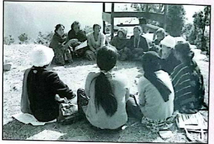
खुल्ला चउरमा लोकतान्त्रिक मञ्चको बैठक गर्दै महिलाहरू