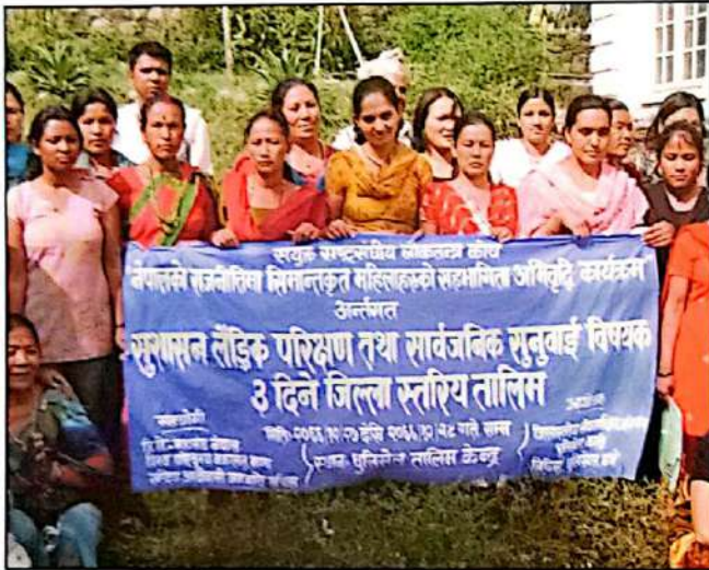
सुशासन, लैंगिक परीक्षण तथा सार्वजनिक सुनुवाई तालिमका सहभागी काभ्रेका महिलाहरू