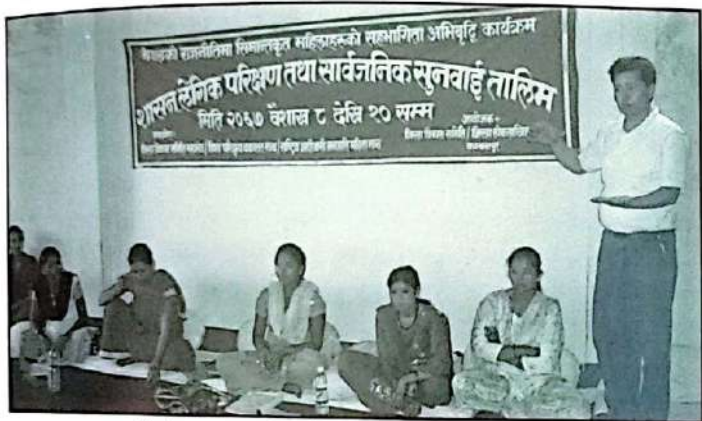
सार्वजनिक सुनवाई तालिममा सहभागी र प्रशिक्षक

पाँच वटै जिल्लाको बहस कार्यक्रममा उपस्थित महिला सहभागीहरूबाट प्राप्त सुभाषाहरूलाई राष्ट्रिय तहमा संविधानसभा अध्यक्ष लगायत समानदहहरू तथा अन्य सरोकारवालाहरूलाई जानकारी गराई सीमान्तकृत महिलाहरूको मुद्दालाई नयाँ संविधानमा समेटनको लागि आवश्यक पहल गर्न महत्वपूर्ण सहयोग पुऱ्याएको छ। पाँच वटै जिल्लास्तरीय बैठकबाट संकलित उक्त सुभाषाहरूलाई आवश्यक समायोजन गरी राष्ट्रियस्तरमा आयोजित बहस कार्यक्रममाफत संविधान सभाका अध्यक्ष सम्माननीय सुवासचन्द्र नेम्बाङ्गसमक्ष पेश गरिएको थियो। साथै उक्त सुभाषाहरूलाई लोकतान्त्रिक महिला मञ्चका पदाधिकारीहरूले राष्ट्रपति महामहिम डा. रामवरण यादव तथा सम्माननीय प्रधानमन्त्री माधवकुमार नेपाल समक्ष पेश गरेका थिए।