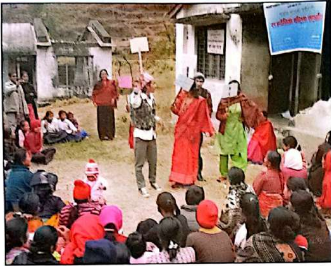
लमजुडमा सडकनाटक प्रदर्शन गर्दै कलाकारहरू