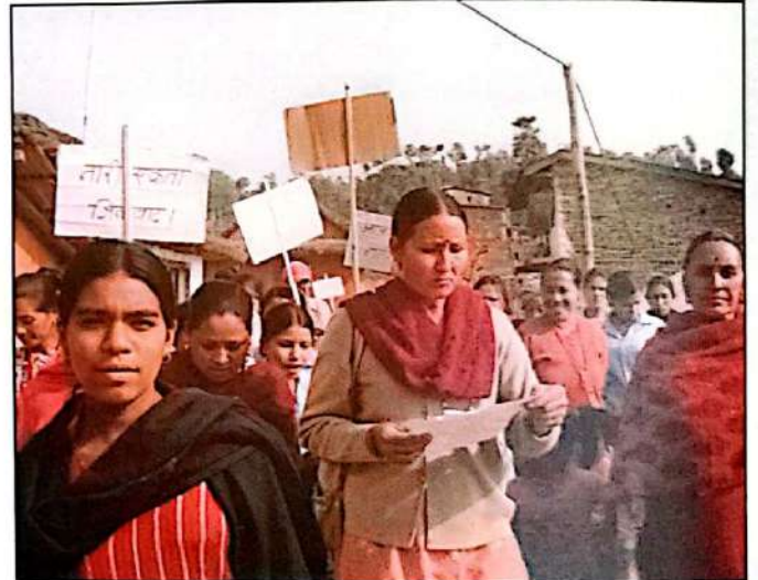
अन्तर्राष्ट्रिय महिला दिवस (८ मार्च) मनाउँदै संखुवासभाका महिलाहरू

तपाईं पनि राजनीतिमा सीमान्तकृत महिलाहरूको सहभागिता अभिवृद्धि गर्न सहयोग पुऱ्याउन चाहानुहुन्छ भने हामीलाई सामग्री पठाई सहयोग गर्नुहोस् । हामी तपाईंले पठाउनु भएको उचित सामग्री त्रैमासिक बुलेटिन वा वेडियोमार्फत प्रसारण गर्नेछौं ।