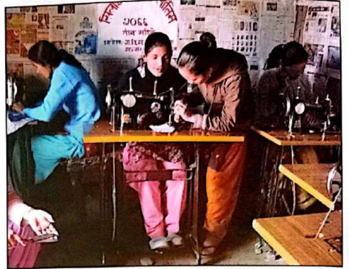
सिलाइ कटाइ तालिम लिदै संखुवासभा लोकतान्त्रिक महिला मञ्चका महिलाहरू