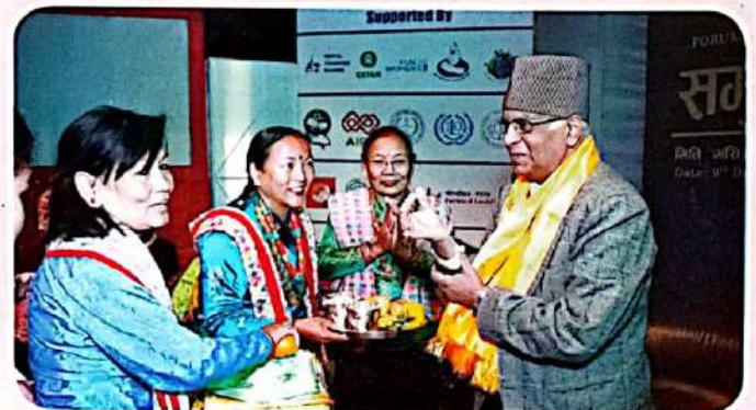
▲ आठौँ मानव अधिकार राष्ट्रिय महाभेलामा थकाली संस्कारबाट अतिथिको स्वागत गरिँदै ।