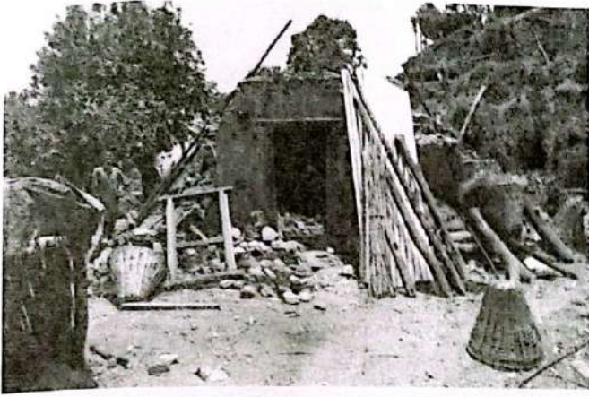
वैशाख १२ गते, २०७२ मा आएको विनाशकारी महाभूकम्पले क्षति गरेको घर, सिन्धुपाल्चोक ।