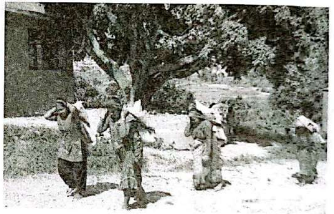
दनुवार महिलाहरू चामलको बोरा बोकेर आफ्नो घरतर्फ जाँदै । देवभूमि बालुवा, काभ्रे ।