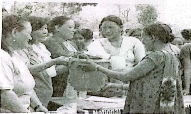
संस्थाको अध्यक्ष तथा उपाध्यक्षबाट सिन्धुपाल्चोकमा राहत सामग्री वितरण गर्दै ।