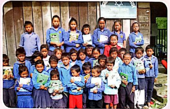
▲ वनकरिया विधार्थीहरू, वनकरिया वस्ती, मकवानपुर ।