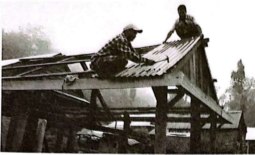
मकवानपुर बनकरिया बस्तीमा घर निर्माण गर्दै ।