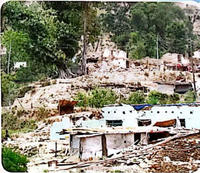
▲ भूकम्पले क्षतिग्रस्त घरहरू, माफी गाउँ, सिन्धुपाल्चोक ।