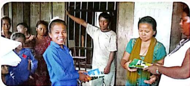
▲ चेपाङ विधार्थीहरूलाई निफ्का पदाधिकारीहरूबाट शैक्षिक सामग्री वितरण गरिँदै, धादिङ ।