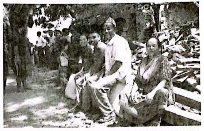
दनुवार महिला र पुरुषहरू चामलका बोराका साथमा, देवभूमि बालुवा, काभ्रे ।