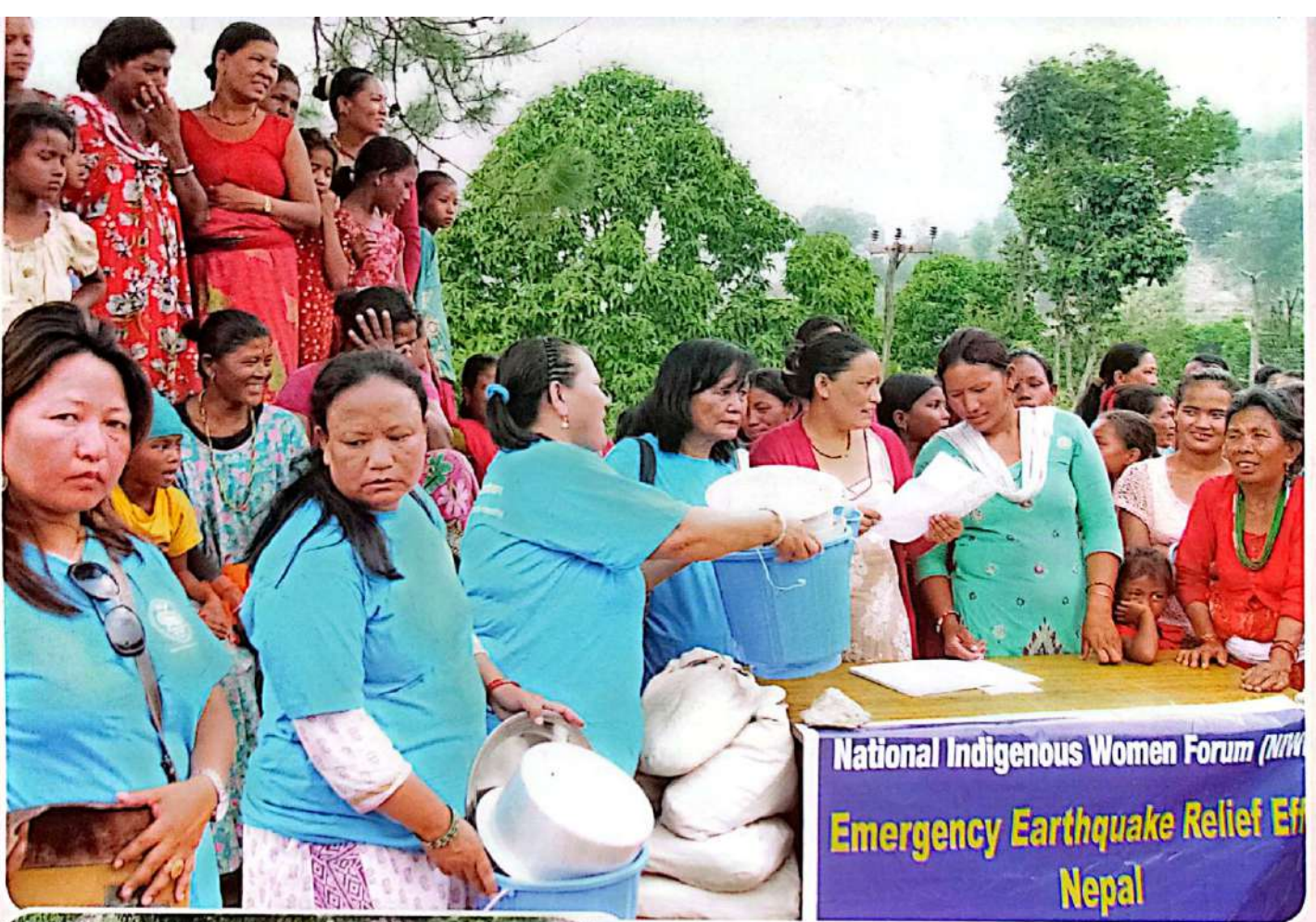
▲ निफ्का पदाधिकारीहरूबाट भूकम्प पीडितलाई राहतका सामग्री वितरण गर्दै ।